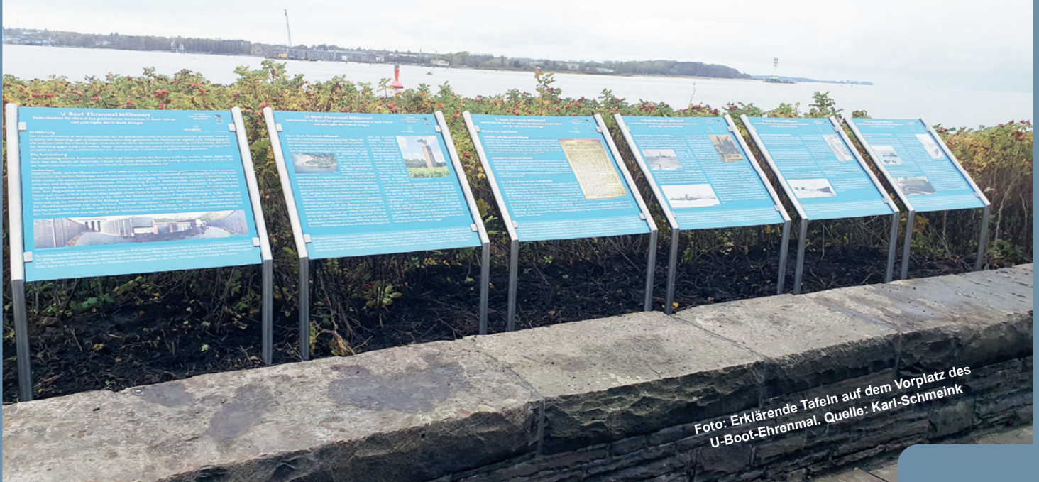
Foto: Erklärende Tafeln auf dem Vorplatz des U-Boot-Ehrenmal.

Spendenbescheinigungen können nur bei Vorliegen aktueller Adresse erteilt werden!